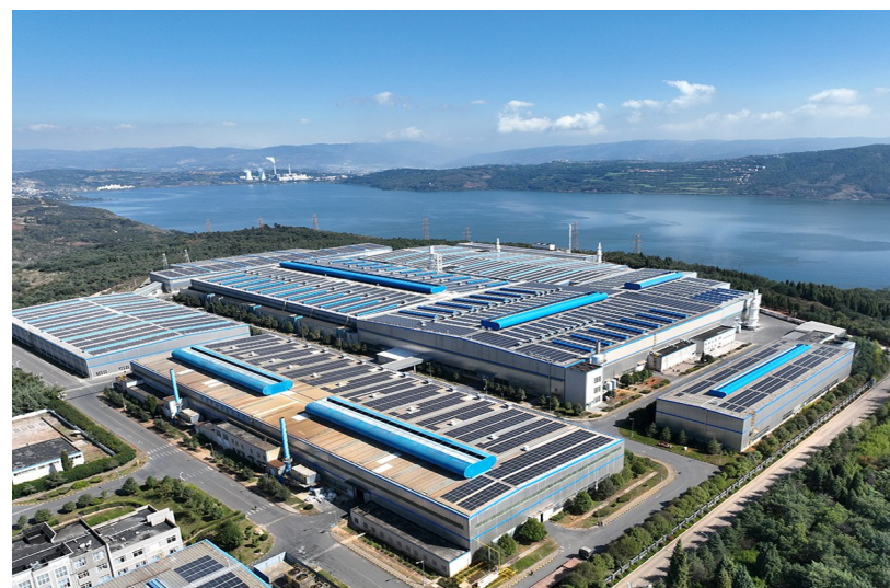
图为云铝阳宗海绿色铝产业园综合智慧能源示范项目全景图。

近两年,中铝股份以提升ESG评级为目标,从提升ESG管理水平、优化ESG信息披露、加强与资本市场沟通三方面着力开展ESG评级指标体系研究,积极响应上市监管机构、投资者及评级机构的监管诉求,持续改善公司在ESG实践和披露层面的短板,加强公司ESG报告、中期报告中ESG工作亮点等信息披露,获得了资本市场的高度认可。中铝股份标准普尔信用评级从“BBB-”上调到“BBB”,MSCI ESG评级由CCC提升到B级,惠誉维持中铝股份有色金属行业“A-”的最高评级,连续4年获得上海证券交易所信息披露A级评价,大大提升了中铝股份在资本市场的形象和地位,也为中铝股份乃至中铝集团在资本市场融资创造了有利条件。中铝股份连续两年入选“央企ESG·先锋50指数”,获评首届“ESG金牛奖·先锋企业”和“上市公司ESG优秀实践案例”。