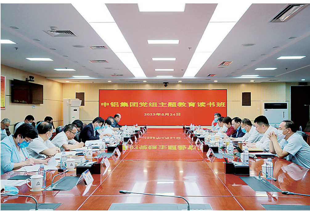
▲图为中铝集团党组主题教育读书班现场。

读书不觉已春深,一寸光阴一寸金。在全党上下深入开展学习贯彻习近平新时代中国特色社会主义思想主题教育之际,4月26日至5月25日,中铝集团党组在中央主题教育第51督导组指导下,举办学习贯彻习近平新时代中国特色社会主义思想主题教育读书班。此次读书班是中铝集团党组坚持以学铸魂、以学增智、以学正风、以学促干的一次全面深刻的政治教育、理论熏陶、思想淬炼和精神洗礼。“全体党员干部要以开展本次主题教育读书班为契机,读原著、学原文、悟原理,不断锤炼党性修养、坚定理想信念,增进政治认同,推动知行合一,紧紧围绕解决历史遗留问题、推动当期生产经营变革、推动经济高质量发展,加快十大重点专项工作落实,做到‘不以口号代替战略,不以战略代替规划,不以规划代替计划,不以计划代替执行,不以执行代替效果’。”中铝集团党组书记、董事长、主题教育领导小组组长段向东在开班式上强调。