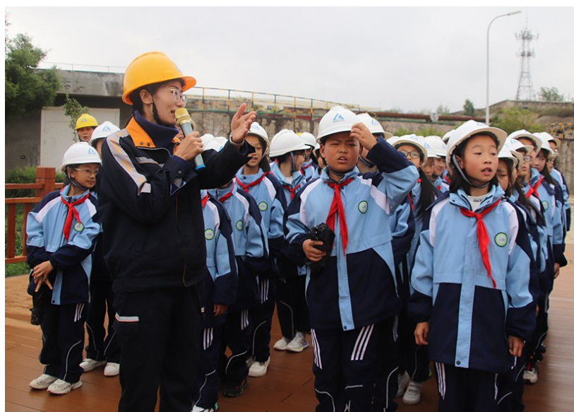
图为云南省曲靖市会泽县翠屏小学70余名师生走进会泽冶铸园参加“拥抱绿色生态,感受美丽会泽”生态环境保护公开日活动。

——做到文化认同。中国铜业提出“铜铸筑梦 超越同行”的社会责任理念,通过编制企业文化手册,创作《铜之歌》,开展“铜文化月”“歌唱祖国,铜铸筑梦”等一系列活动,在融入企业战略、日常运营中推动责任文化的深植,使责任成为利益相关方和员工员工的共同价值追求和行动自觉。