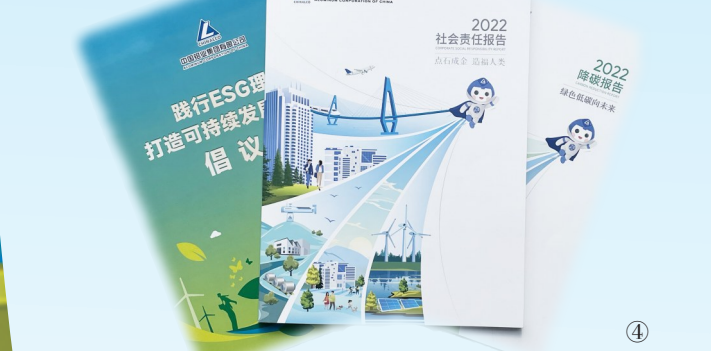
图①为中铝集团党组书记、董事长段向东发表主旨讲话。 图②③为中铝集团党组领导段向东、刘建平、叶国华、董建雄、皇甫莹与2022年度社会责任优秀案例、优秀影像作品获奖者合影。 图④为中铝集团第七届降碳节上发布的《2022社会责任报告》《2022降碳报告》和《践行ESG理念打造可持续发展新范式倡议书》。