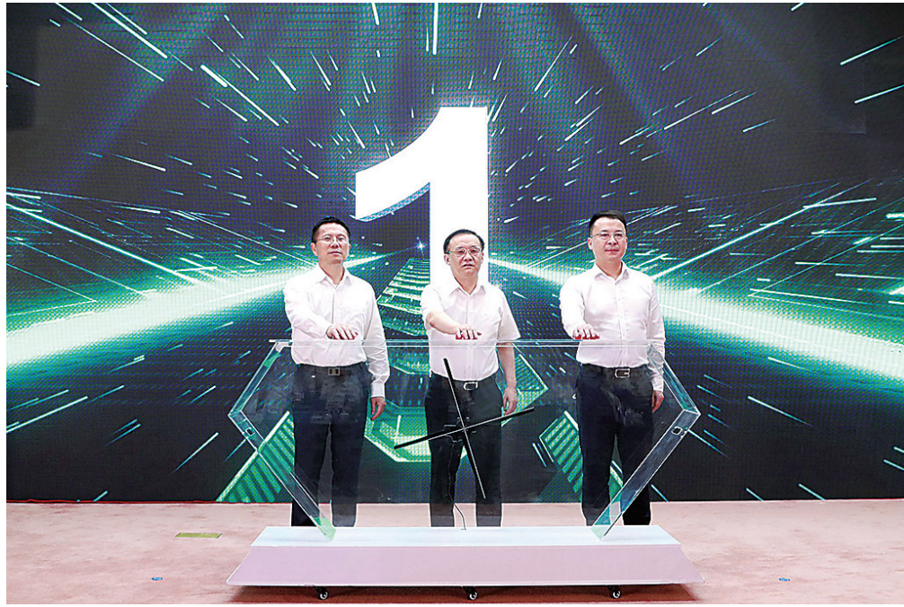
▲图为汪洋、段向东、刘建平共同启动发布仪式。

本报讯(记者 张潇潇)6月19日,中铝集团第七届降碳节暨2022社会责任报告发布会在集团总部举办,发布了中铝集团及所属企业社会责任报告、ESG报告、降碳等专项报告及社会责任“112”指标体系成果,发出了践行ESG理念打造可持续发展新范式的倡议。国务院国资委社会责任局副局长汪洋出席活动并致辞。中铝集团党组书记、董事长段向东,党组书记、董事刘建平,党组成员、董事刘建平,党组副书记、董建雄、皇甫莹出席活动。