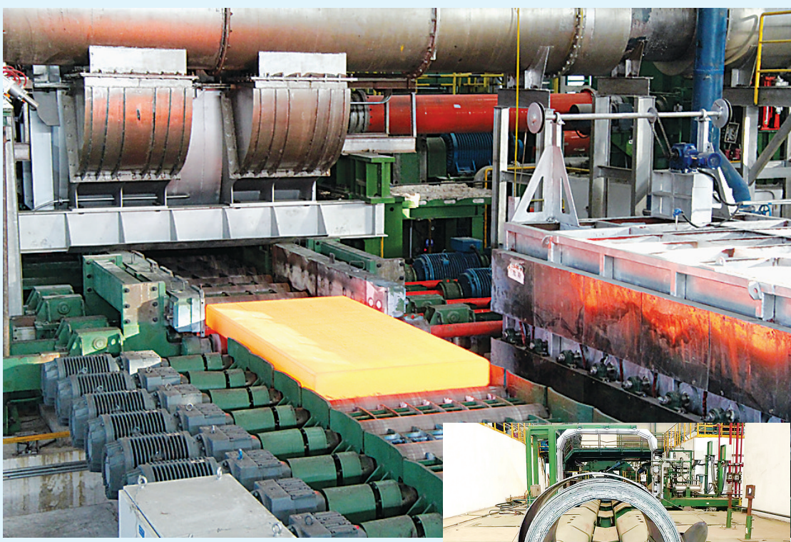
▲图为中铝沈加某镍基高温合金卷材生产现场。 ▶图为轧制出的镍基高温合金卷材。

本报讯 近日,中铝高端制造所属中铝沈加试制某镍基高温合金卷材轧制成功,截至目前已产出供货。据悉,该产品是四代高温气冷堆蒸汽发生器的核心材料,具有优异的抗氯离子应力腐蚀开裂能力,以及良好的热加工性能,广泛应用于燃气涡轮发动机、管道输送、海水专用设备、核动力设备、核反应堆构建及宇航等领域。该镍基高温合金卷材的试制