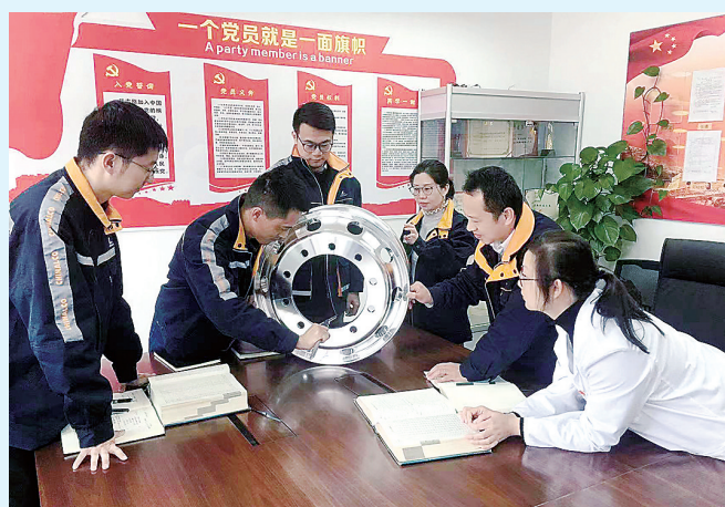
▲图为项目组成员开展技术研讨。 ▲图为高强6xxx铝合金棒料生产现场。

本报讯 近日,由中铝材料院开发的高强6xxx铝合金优质锻棒制备集成技术有效突破了高端棒料依赖进口铸造装备的瓶颈,在中铝集团成员企业中推广应用后,实现了铝合金棒料产品迭代升级。