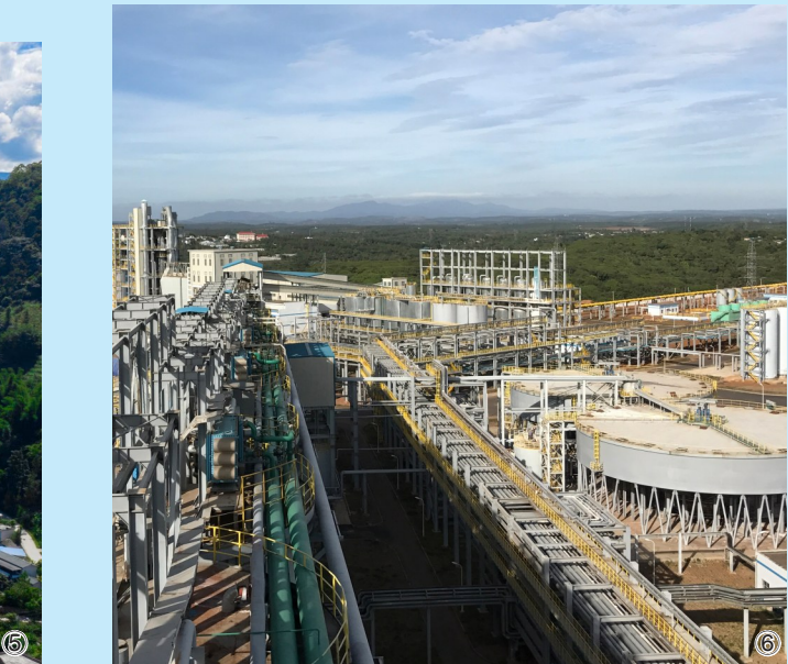
图④成都建川博物馆综合陈列馆双层铝合金网壳项目主体工程 图⑤云南云岭高速公路新塘房段 图⑥越南仁基650千吨/年氧化铝项目

的助推作用,企业因创新而茁壮,因创新而辉煌。目前,六冶具有“国家企业技术中心”“国家高新技术企业”称号,成为河南省博士后创新实践基地,牵头或参加国家相关标准制定4项,累计获得发明及实用新型专利授权90余项。2021年,六冶科技重工业迈入国家高新技术企业行列,并获批郑州市高端金属桥梁结构工程研究中心,标志着六冶自上而下、多层次、多领域构建技术研发机构取得了较大突破。