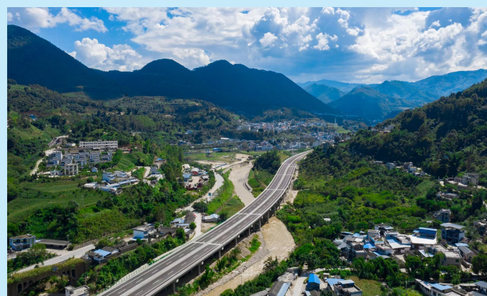
图为六冶承建的部分重点工程项目: