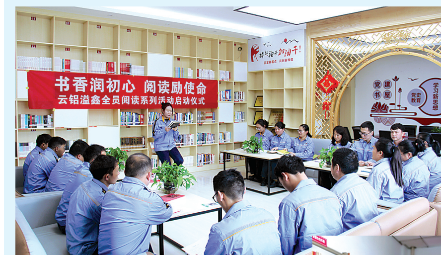
▲图为云铝益鑫“书香润初心、阅读励使命”全民阅读活动现场。

今年4月23日是第28个“世界读书日”。为推动全社会形成爱读书、读好书、善读书的浓厚氛围,中铝集团所属各单位积极探索推广全民阅读新模式,创新内容、创新服务、创新平台,通过形式多样的主题活动为读书日增色,让广大职工感受阅读之美、乐享阅读之旅。