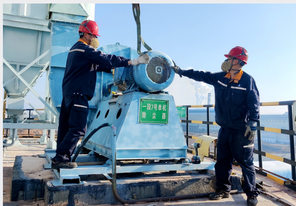
近日,云铝涌鑫认真落实设备节能措施,组织检修工区对两套氧化铝铝输送系统58台高耗能电机进行更换作业,进一步优化提升设备性能,持续降低辅助工序电耗,现已完成39台高效节能电机更换工作。图为检修人员起吊电机。